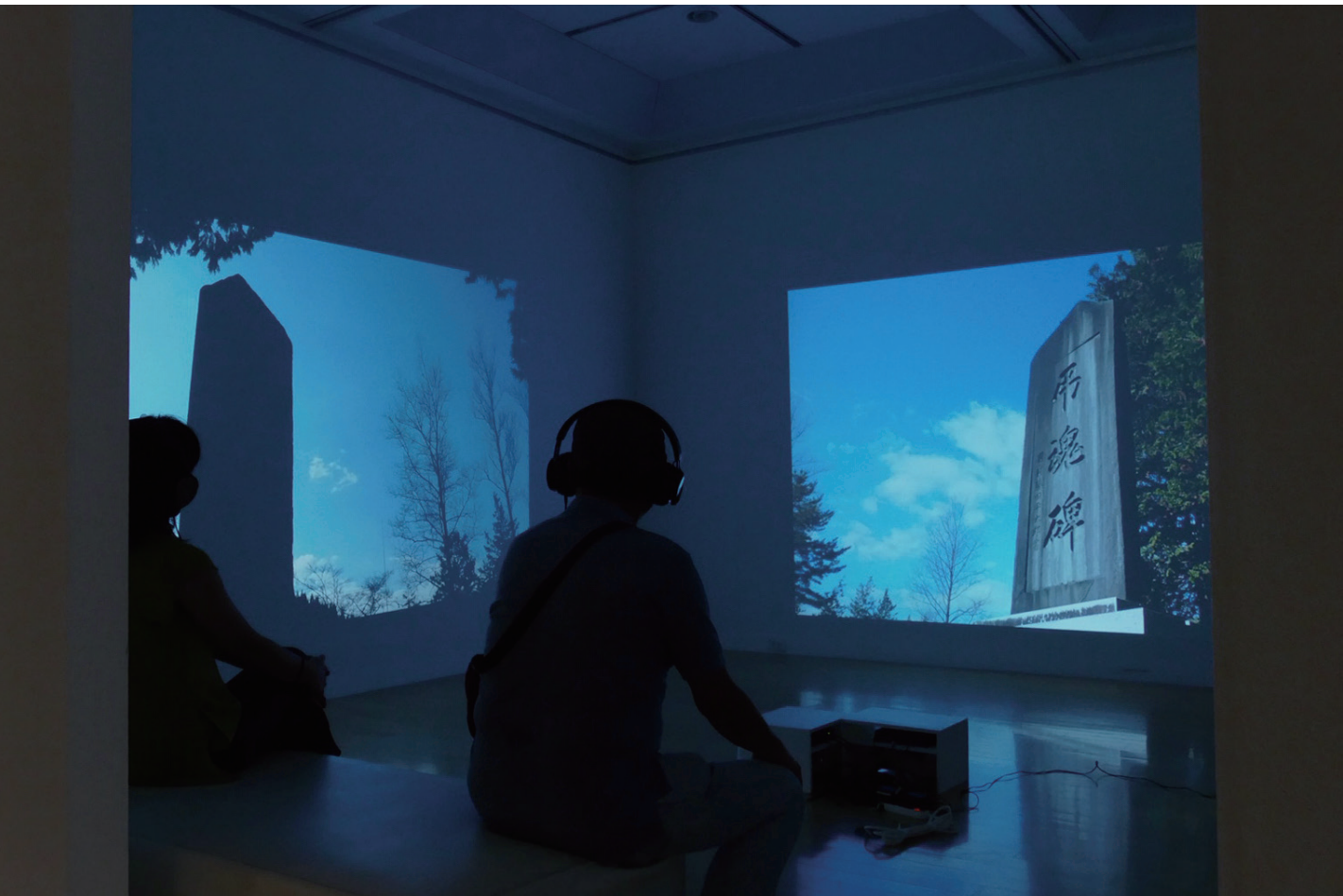
「岸に立つ」横浜市民ギャラリーあざみ野の展示の様子 2019年 Standing on the Shore, as seen at an exhibition in Yokohama Civic Art Gallery Azamino (2019)