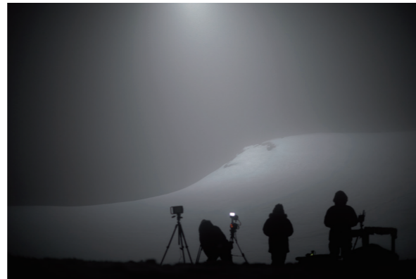
《Towards No Earthly Pole》2017年 制作風景 Making of Towards No Earthly Pole , 2017 Copyright of the artist