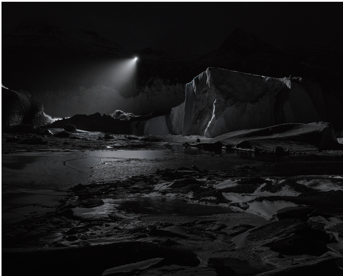
《Towards No Earthly Pole - Ellsworth》2019年 / Towards No Earthly Pole - Ellsworth, 2019

この非常に強い光は、氷に覆われた風景の上をさまよったり、 停止飛行しながら隠れたり現れたりを繰り返して、 真下の地形を照らし出しています。