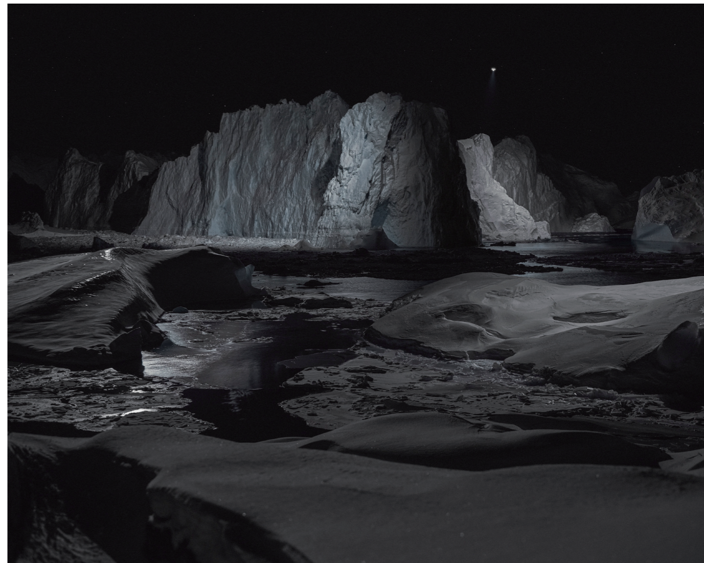
《Towards No Earthly Pole - Slessor》2019年 / Towards No Earthly Pole - Slessor, 2019