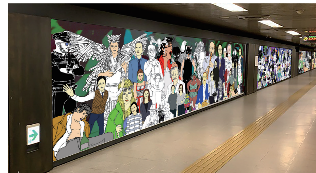
《Real Life Matters》 札幌大通地下ギャラリー 500m美術館 での展示プラン Real Life Matters, Installation plan at Sapporo Odori 500-m Underground Walkway Gallery

私の作品は、ものごとの狭間にあるものに言及しています。それは、地に足をつけたまま、上を見上げ空を仰ぐ人間のあり方です。伝統に深く根ざしながらも、同時に技術革新の頂点に立っている日本社会の発展は、その明らかな例です。《Real Life Matters》は、札幌の人々のバーチャルな集いであり、現代社会の投影でもあります。