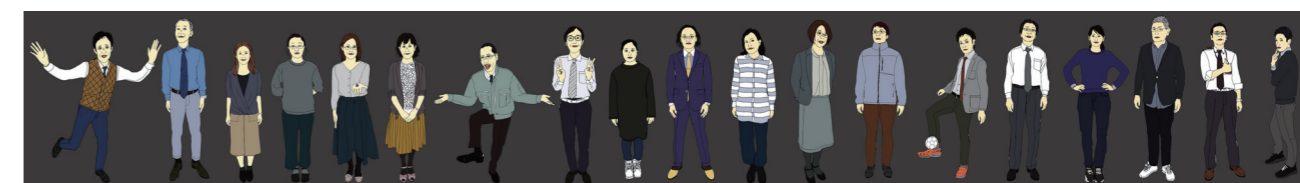
《Real Life Matters》ドローイング / Real Life Matters, drawing