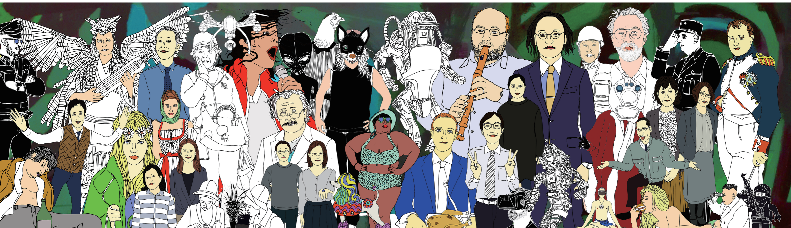
《Real Life Matters》制作中の作品の一部 / Real Life Matters, part of a work (work in progress)