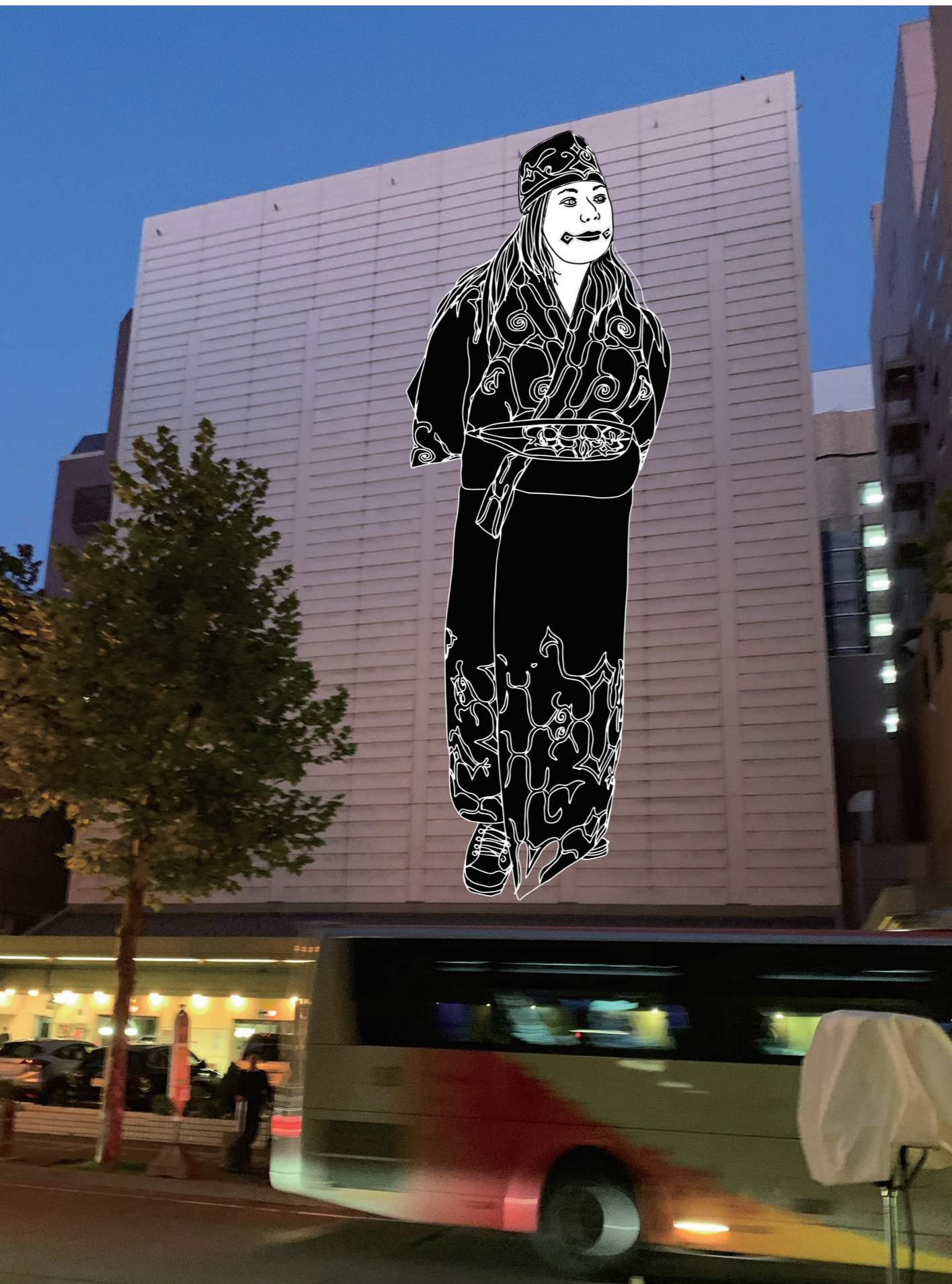
《Real Life Matters》 SIAF2020のための屋外作品のイメージ(巨大な人物画を建物の壁面に設置) / Real Life Matters, Image of an outdoor work for SIAF2020 (A large portrait painting to be set on a wall of a building)