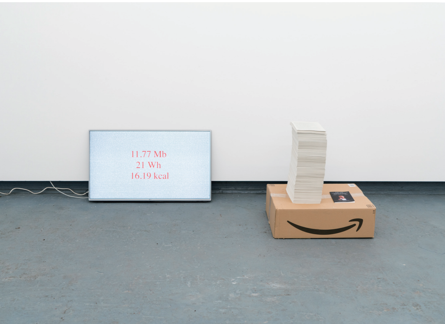
SIAF2020年開催予定の芸術展『The Hidden Life of an Amazon User』2019年 Work that the artist planned to exhibit at SIAF2020 The Hidden Life of an Amazon User, 2019