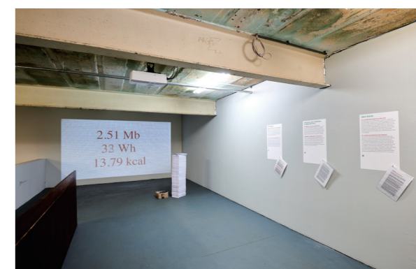
「BIG D@T@! BIG MONEY!」展 (HALLE 14、ドイツ・ライプツィヒ) での展示風景。 Installation view of the exhibition "BIG D@T@! BIG MONEY!" (HALLE 14, Leipzig, Germany)