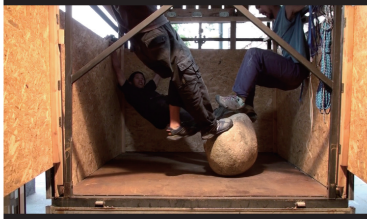
2019年6月から12月にかけて、コペンハーゲンからワルシャワまで石を運んだ記録映像《Itte Kaette》からのスチル。トラックに石を積み、ベルリンを通過してワルシャワへ。道中で石と遊ぶ A still from Itte Kaette , a documentary film about the transport of the stone from Copenhagen to Warsaw from June to December 2019. The stone was loaded onto a truck and driven through Berlin to Warsaw. Playing with the stone during the journey.

→ インタビュー動画はこちら Watch the video interview.