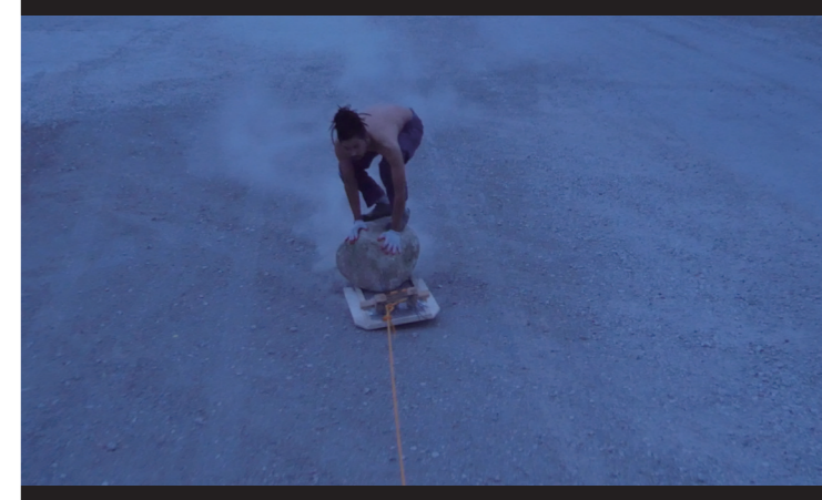
2019年6月から12月にかけて、コペンハーゲンからワルシャワまで石を運んだ記録映像《Itte Kaette》からのスチル。トラックに石を積み、ベルリンを通過してワルシャワへ。道中で石と遊ぶ A still from Itte Kaette , a documentary film about the transport of the stone from Copenhagen to Warsaw from June to December 2019. The stone was loaded onto a truck and driven through Berlin to Warsaw. Playing with the stone during the journey.