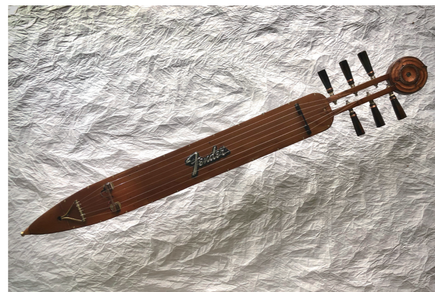
オキが制作したトンコリ / Tonkori created by OKI