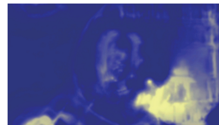
《AINU ASSET》デモンストレーション映像のスクリーンショット Screen shots from the AINU ASSET demonstration video