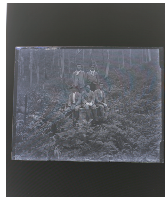
作品制作のためにリサーチした、天塩研究林の写真 1930年 Photo of the Teshio Experimental Forest, 1930. The artist researched this place for the creation.