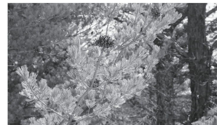
風で動く流氷のイメージ。動画からのスチル Image of drift ice moved by the wind. Still from video