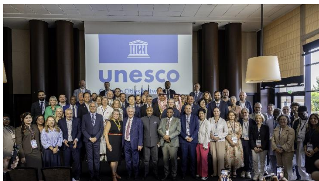
2025年ユネスコ創造都市ネットワーク年次総会の様子

ユネスコ（国際連合教育機関）創造都市ネットワーク（UNESCO Creative Cities Network）は、創造的・文化的な産業の育成、強化によって都市の活性化を目指す世界の都市が、国際的な連携・相互交流を行うことを支援するため、2004年にユネスコが創設したネットワークです。登録分野8つのうちの一つがメディアアーツで、デジタル技術などを用いた新しい文化や、クリエイティブ産業の発展を目指すと共に、都市生活の改善に結びつくメディアアーツの振興や、文化多様性の理解等を促す電子芸術の成長をけん引する都市が加盟します。現在26カ国27都市が加盟しており、札幌市は2013年、フィンランド・オウル市は2023年に加盟しました。