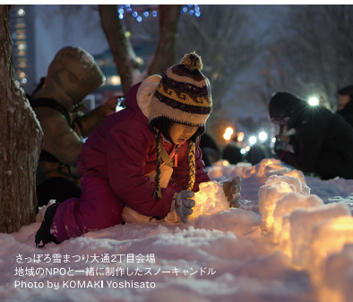
さっぽろ雪まつり大通2丁目会場 地域のNPOと一緒に制作したスノーキャンドル