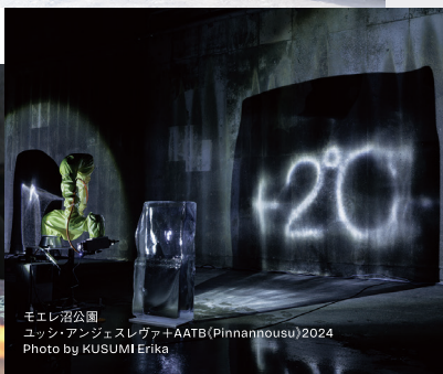
モエレ沼公園 ユッシ・アンジェスレヴァキ AATB (Pinnannousu) 2024