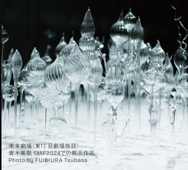
未来劇場(東丁目劇場施設) 音木美歌 SIAF2024での展示作品