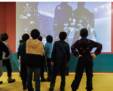
フジ森〈自分だけの雪の結晶、ゆきフレーム〉2023

SIAFは、皆さんと一緒につくる芸術祭です。作品を見るだけではなく、一緒に話す、一緒につくる、一緒におもてなしする。誰でも集まることができるプラットフォームです。参加者としてワークショップやイベントを楽しんだり、サポーターになって来場者を案内したり！アートの知識がなくても大丈夫！楽しみ方の入口はたくさん用意しています。