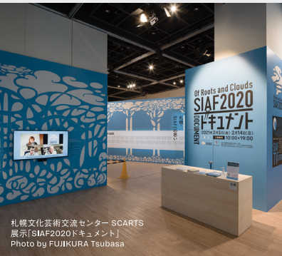
札幌文化芸術交流センター SCARTS 展示「SIAF2020ドキュメント」