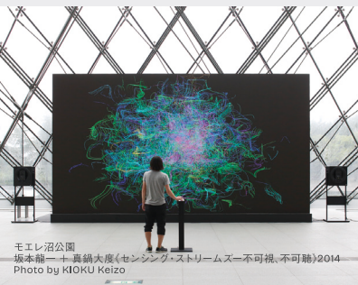
モエレ沼公園 坂本龍一 × 真鍋大度「センシング・ストリームズー不可視、不可聴」2014