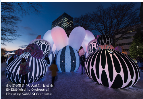
さっぽろ雪まつり大通2丁目会場 ENESS(Airship Orchestra)

SIAFは3年に一度、札幌で世界の最新アート作品に出合える特別なアートイベントです。絵画や彫刻だけではなく、映像や空間全体を使った作品、プログラミングやAI(人工知能)などのテクノロジーを使った作品、身近な素材で新しい風景を生み出す作品など、さまざまな作品を紹介します。