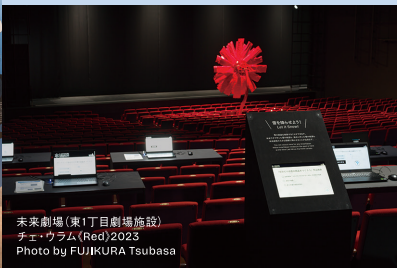
未来劇場(東1丁目劇場施設) チェ・ウラム(Red)2023