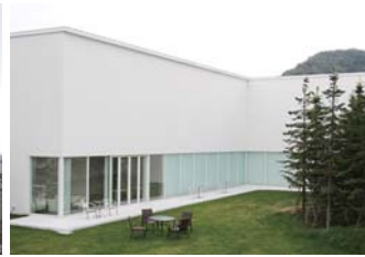
札幌宮の森美術館