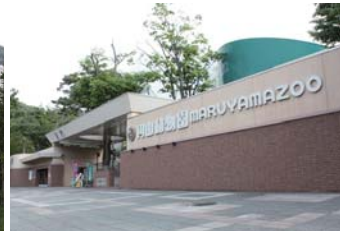
札幌市円山動物園

札幌国際芸術祭実行委員会では、音楽家の大友良英をゲストディレクターに迎え、今年8月6日に開幕する札幌国際芸術祭2017（略称 サイアフ SIAF2017）の準備を進めています。