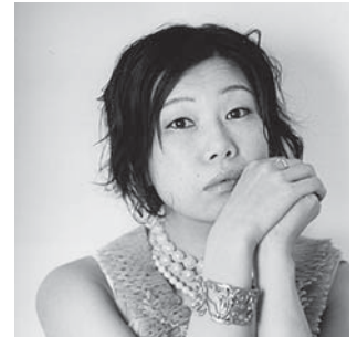
指輪ホテル（芸術監督：羊屋白玉）