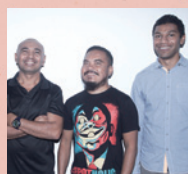
ジユップル1&ザブルダワッダ TJUPURRU & THE BULLDAWDDA