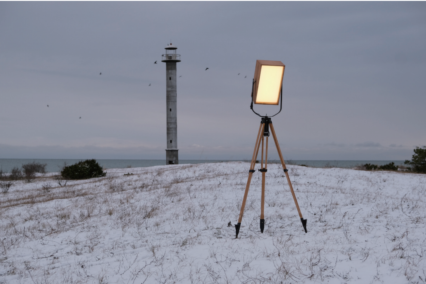
《Touch of the network》2019年。冬の嵐で地面から緩んで浮いてしまった廃墟のキプサーレ灯台近く（エストニア）。SIAF2020では、映像（シングルチャンネル・ビデオ）とともに三脚を設置する予定だった