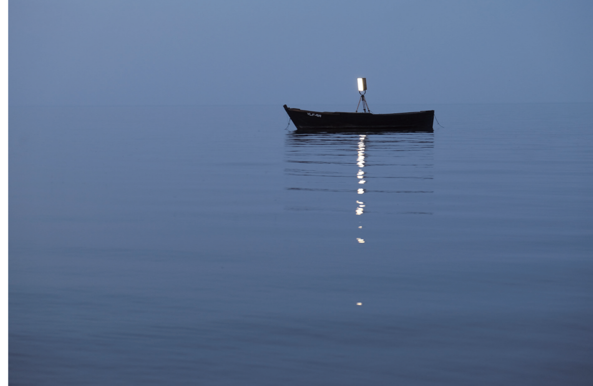
湖岸にある古いボートの格納庫での展示のためにペイバス湖（エストニア）で撮影した《Touch of the network》 Filming Touch of the network on Lake Peipus for a show in an old boat hangar on the shore

これらの自律したプログラムの目的は不透明で、私たちにわかりません。そこで、自律したプログラムが《Touch of the network》と通信するたびに、三脚の上のライトがアクセスされた方向に向きを変え、比喩的に物理的または地理的な場所に向けて光を「反射」させます。《Touch of the network》は2つの要素で構成されています。ひとつは物理的な立体作品ですが、もうひとつは実際の環境でその作品が動いている様子を映し出したビデオ作品です。この作品を展示する際には、土地の文脈をふまえて映像を撮り直すことで、効果的に環境の一部となるようにしています。SIAF2020では、モエレ沼公園に立体物を設置し撮影する計画でした。