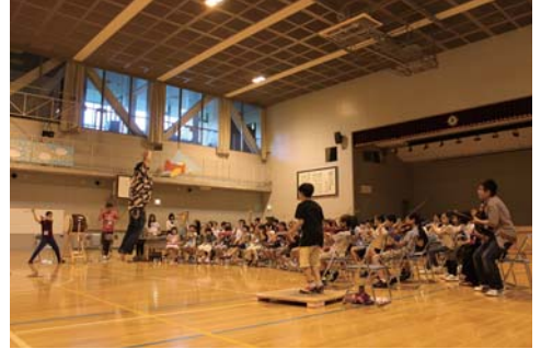
さっぽろコレクティブ・オーケストラ