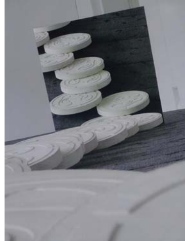
鈴木 昭男《NOISELESS》(2007年) 京都国立近代美術館