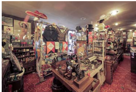
レトロスペース坂会館