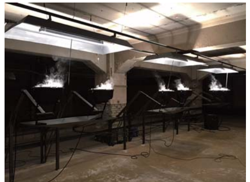
端 聡《液体は熱エネルギーにより気体となり、冷えて液体に戻る。そうあるべきだ。2016》あいちトリエンナーレ2016での展示風景