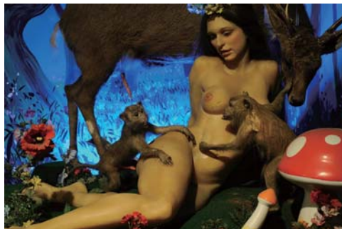
北海道秘宝館「春子」