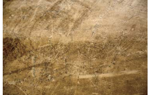
赤平炭鉱坑内模式図(部分)