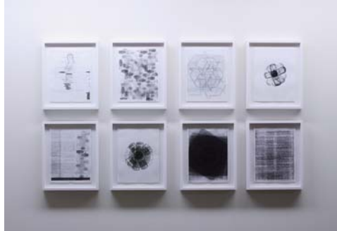
クリスチャン・マークレー 《Studies for Variations on a Silence (project for a recycling plant) Tokyo》2005年