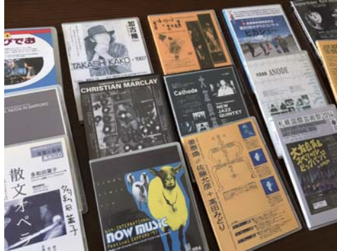
NMAライブ・ビデオ アーカイブ