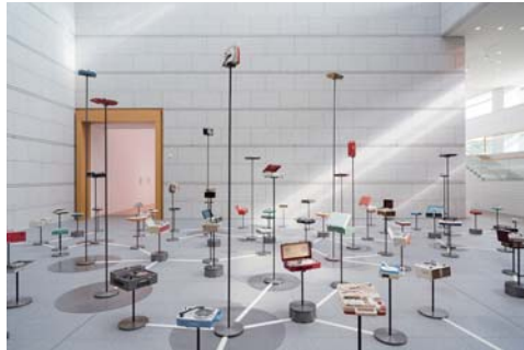
大友良英+青山泰知+伊藤隆之 《without records - mot ver. 2015》2015年