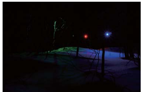
堀尾 寛太 藻岩山での実験風景