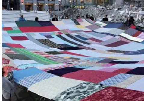
大風呂敷プロジェクト