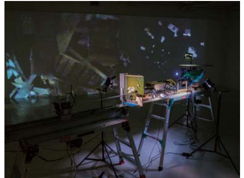
伊藤隆介 《Realistic Virtuality (Field Watcher)》2014年