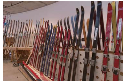
中崎透 × 青森市所蔵作品展「シュプールを追いかけて」の 展示風景、2014年