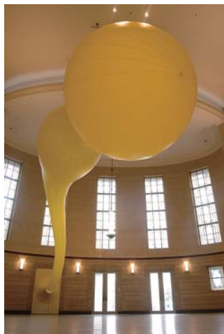
松井紫朗《The Inside's Outside》2008年