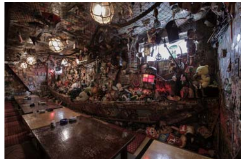
大漁居酒屋てっちゃん