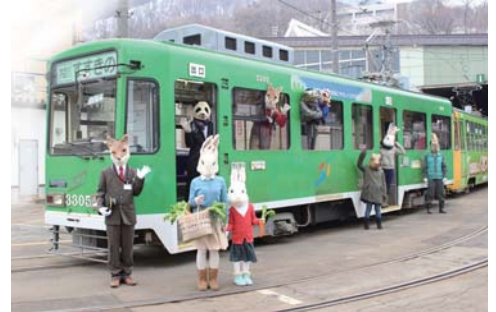
「札幌市電×指輪ホテル」イメージ