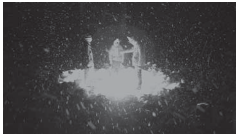
さわ ひらき 参考画像