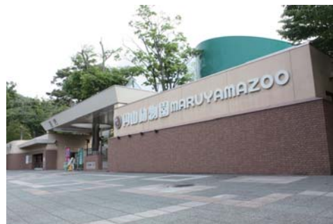
No.6 札幌市円山動物園