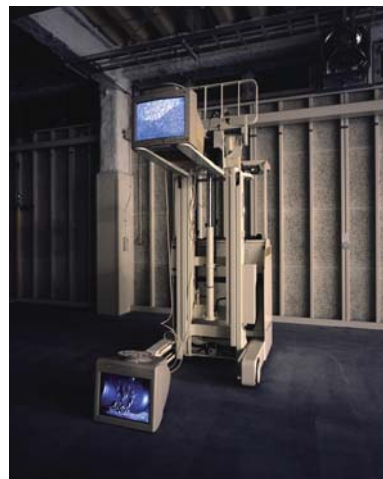
クリスチャン・マークレー《Ascension》2005年 © Christian Marclay / Courtesy of Gallery Koyanagi, Tokyo and Paula Cooper Gallery, New York Photo: Osamu Watanabe