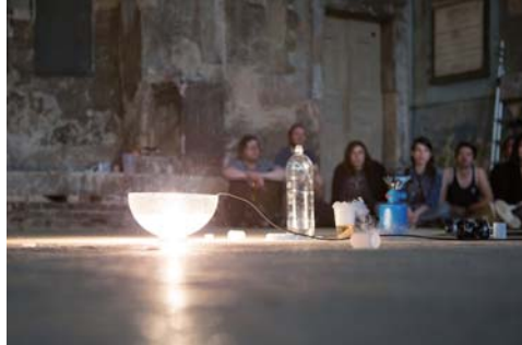
梅田 哲也 At the Moment of Being Heard, サウスロンドンギャラリー, 2013