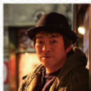
大友良英 | Otomo Yoshihide

アイヌ語で歌を表す「ウポポ」の再生と伝承をテーマに活動。2010 年、初のミニアルバム「MAREWREW」を発表後、活動を本格化。2011 年に自主公演企画「マレウレウ祭り～目指せ 100 万人のウポポ大合唱！～」をスタートさせ、さまざまなアーティストと共演する。マレウレウはアイヌ語で「蝶」のこと。